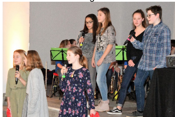
Chor der Realschule

Für den musikalischen Rahmen während der Veranstaltung sorgten die Musikband und der Chor der Realschule mit verschiedenen Beiträgen.