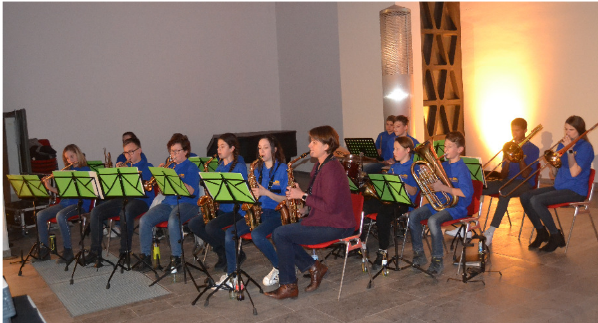
Musikband der Realschule